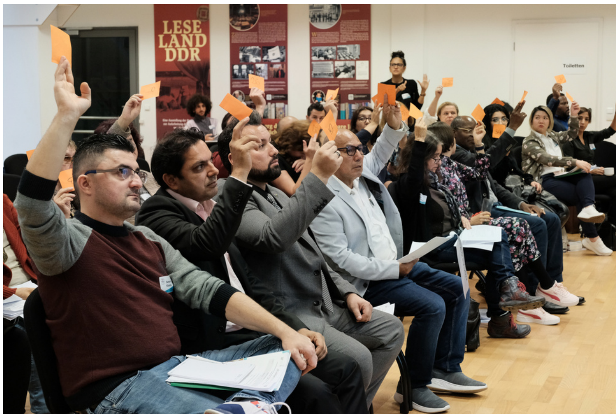
Abstimmung der Delegierten am 8.10.2022

Die Bundesbeauftragte lobte den neuen (post-)migrantischen Jugendpreis und strich besonders das Engagement migrantischer Vereine für Geflüchtete aus der Ukraine hervor. „Ihr seid das moderne Einwanderungsland Deutschland“, sagte sie, und „Für dieses Engagement danke ich euch sehr, bitte macht weiter so – davon können wir gar nicht genug haben!“.