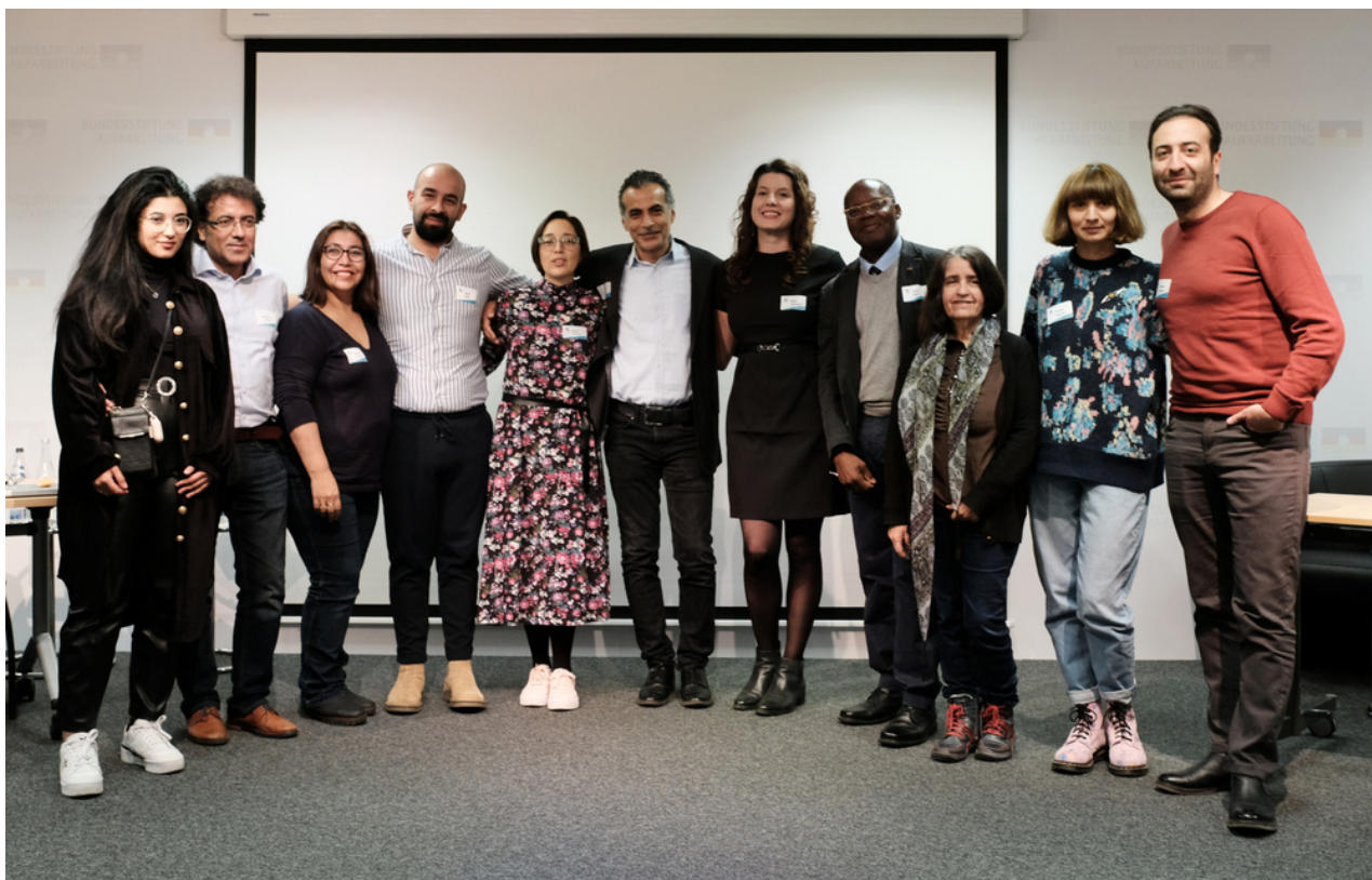
MigraNetz Thüringen